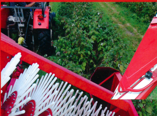
Effective raspberry harvesting