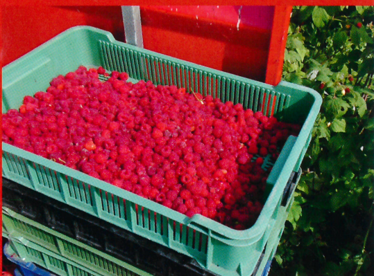
High quality of harvesting fruits