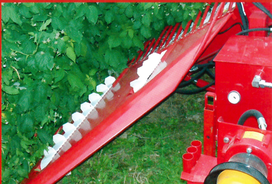
Special active lifter