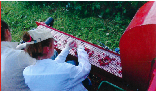
Comfortable selecting conveyor