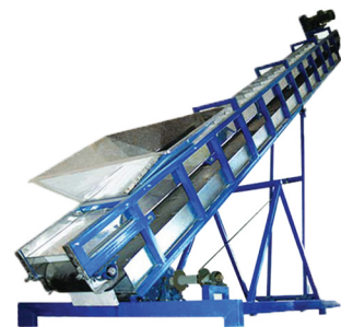
Elevador (Bucket Elevator) RA-100