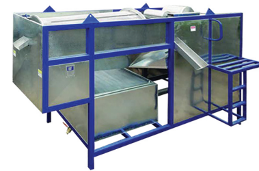
Tanque de flotación (Floating Tank) RA-500