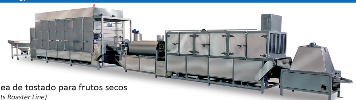
Línea de tostado para frutos secos (Nuts Roaster Line)