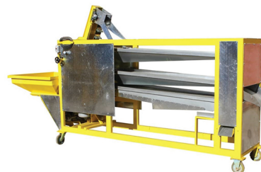
Clasificador (Sorter) 1200-B