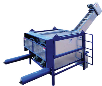
Peladora (Peeler) RA-300