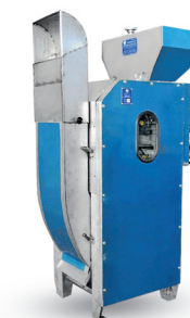
Peladora de grano (Kernel Peeler)