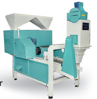
Tamiz y separador (Sieve and Separator)

Una línea completa de maquinaria para el descascarado del fruto seco (A complete line of machinery for de-shelling the Nuts)