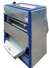
Separador de pistacho peludo (Stick Tight Separator) RA-800