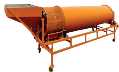
Separador de abiertos y cerrados (Separator O/C) RA-900