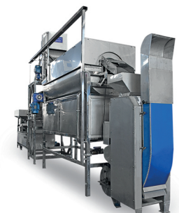
Peladora de grano (Kernel Peeler)