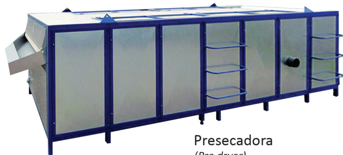
Presecadora (Pre dryer) RA-700