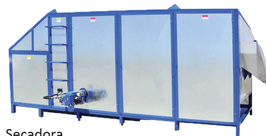
Secadora (Dryer) RA-1100