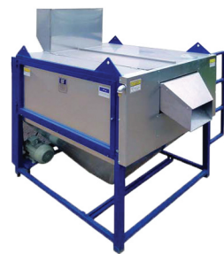
Sistema de lavado (Washing System) RA-400