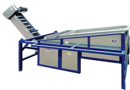
Separador (Separator) RA-600