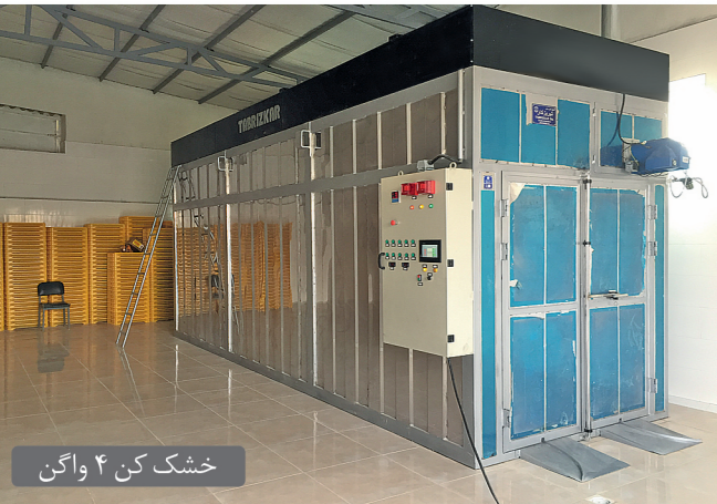
خشک کن ۴ واگن

Tabrizkar design and manufacturing the hot air technology dryerby convection method. We are producing different model of cabinet dryer like 1 wagon, 2wagons, 4 wagons, 6 wagons& 12 meter.-Unique airflow system provide uniform heat & balanced airflow -Stainless steel heat exchanging 3pass system for indirect heating- Energy saving by intelligent program and thermal efficiency- Capabilities for different fuel like Gas, Diesel, Electrical and Biomass- PLC controller and touch screen monitor for easy operation and also monitoring- Data saving for each product (2 program for each one)- Capabilities to design the professional clients requests and customize the software- 2 language software -PM program- Low noise- Heavy structure and heat insulating walls and roof - 12 month guarantee - 10 years supporting - CE mark