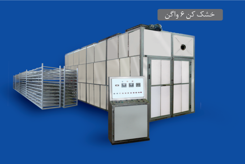
خشک کن ۶ واگن