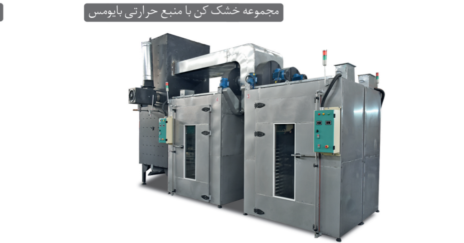
مجموعه خشک کن با منبع حرارتی بایومس