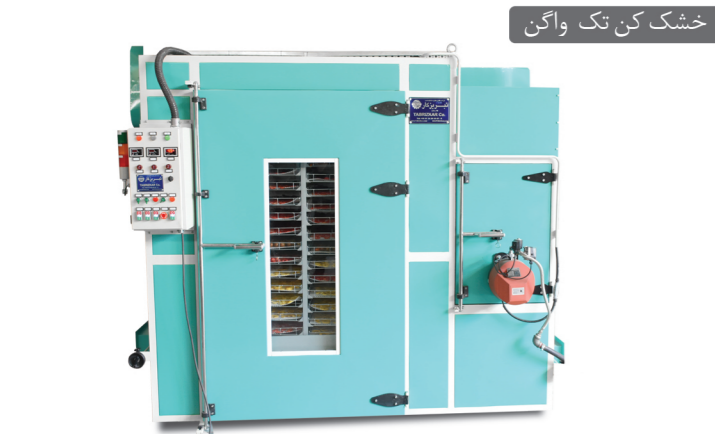
خشک کن تک واگن